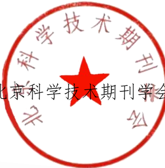
北京科学技术期刊学会