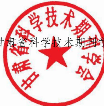
甘肃省科学技术期刊学会