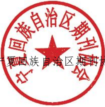
宁夏回族自治区期刊协会